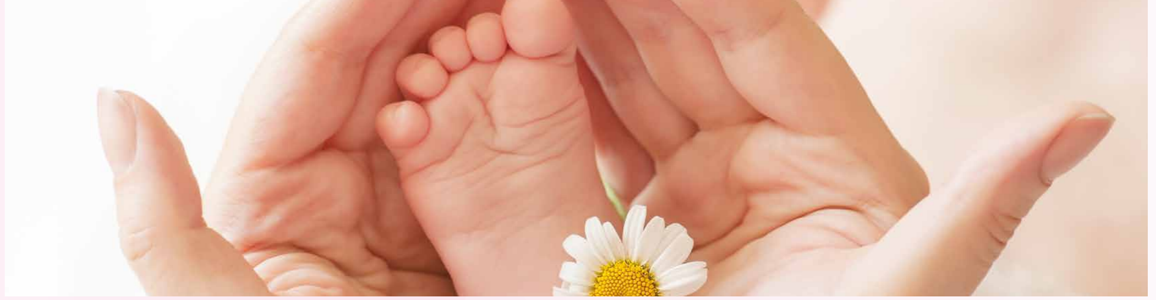
Conception et mise en page erwannfest.fr · Impression: imprimerie BOVI · Imprim'Veit®

68150 RIBEAUUVILLÉ WOLLENSCHLAEGER-FABRE Magalie 3 rue Brandstatt 06 52 39 27 45 CG GYN SIG PAN SDC REED DOM 68160 SAINTE-MARIE-AUX-MINES PICOT Alexia 157 A rue du Maréchal de Lattre de Tassigny 06 50 64 69 19 CG GYN SIG PAN SDC REED DOM 68240 KAYSERSBERG BLANCK Valérie 5 rue du 18 décembre 06 12 86 18 75 valerie.ouar.blanck@gmail.com CG GYN PAN SDC REED DOM